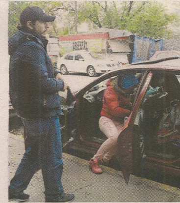
La familia Hernández sobrevive en un auto, y son privilegiados.

Su familia es originaria del estado de Veracruz, pero vive en Monterrey desde hace 5 años. Él cuida a su mamá que es enferma de los riñones y quien necesita diálisis todos los días para mejorar.